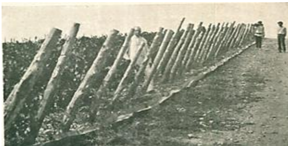
Рис. 4 – Орошение виноградников

ненные бетонным сводом. В стене DD, обращенной к верхней части ущелья, были оставлены отверстия для просачивания воды из подпочвы, а между стенками находился бетонный пол L с уклоном к канаве для стока воды. Канавка также была бетонная, крытая плитами до того места, где она выходила на поверхность земли (GG), затем до виноградников уже в открытом виде. Длина магистральной канавы была чуть более 2 км. В ее края на территории виноградников были вмонтированы жестяные «носки», к которым стыковали вышеупомянутые желоба. Были также предусмотрены специальные задвижки, чтобы останавливать поток воды у нужного «носка» для полива выбранного ряда (рисунок 4).