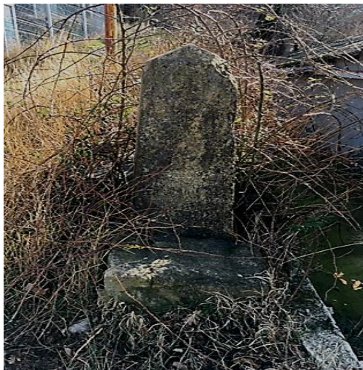
Рис. 8 - Могильный камень основателя имения. Наши дни.

Неполный обход окрестностей 13-го ущелья (Восточный район г. Новороссийска) выявил перестроенное здание винодельни и подвала, террасы под виноградники, остатки системы орошения, а также могильный камень основателя имения Шесхарис – В. А. Осинского (рисунок 8).