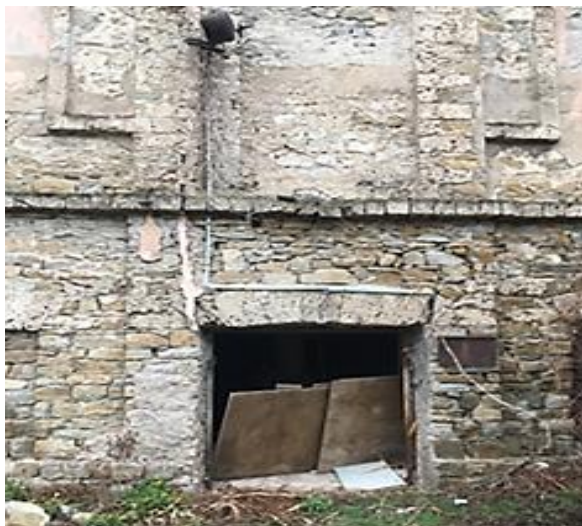
Рис. 7 – Сохранившееся здание с подвалом для хранения вин

Неполный обход окрестностей 13-го ущелья (Восточный район г. Новороссийска) выявил перестроенное здание винодельни и подвала, террасы под виноградники, остатки системы орошения, а также могильный камень основателя имения Шесхарис – В. А. Осинского (рисунок 8).