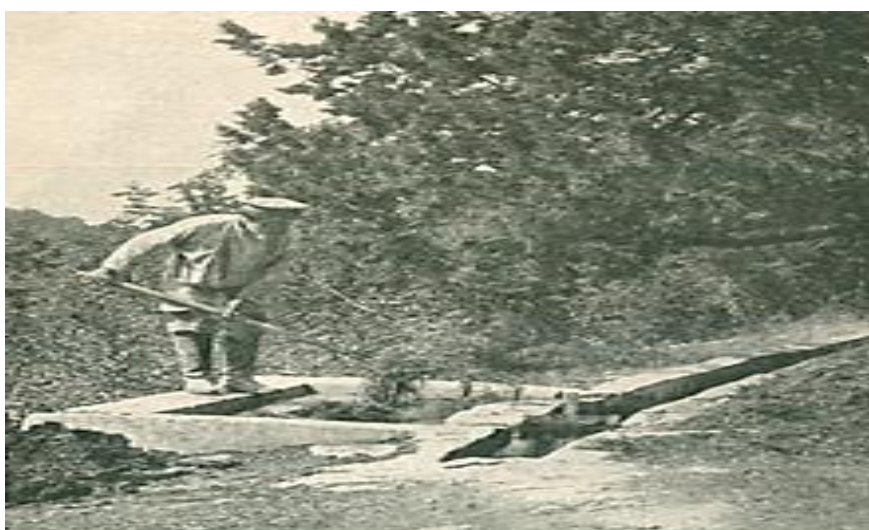
Рис. 5 – Разведение навоза для орошения и удобрения виноградников

Вся эта водопроводная система, благодаря которой можно было орошать любой, даже отдаленный уголок имения, обошлась владельцам оного в 3000 руб. Данная инфраструктура использовалась и для удобрения виноградников в осенний период времени, для чего по разрыхленному междурядью сначала рассыпали суперфосфат, а затем ряды поливались по вышеописанному способу, но уже не чистой водой, а растворенным в ней перегнившим навозом. Для этого на магистрали ниже того места, где от нее отделялась труба, снабжавшая жилые помещения питьевой водой, устроен бассейн, в котором навоз с помощью вил мешался с водой (рисунок 5).