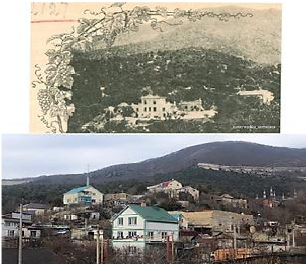
Рис. 1 – Общий вид имения Шесхарис 1913/2023

Рислинг, Каберне (Лафит), а у самого шоссе - Сомильон (Сотерн). Выше шоссе: Рислинг, Каберне и Бургундский (Португизер). Около 3 га было отведено для столовых сортов винограда, как ранних, так и поздних: Шасла дорэ, Шасла розовая, Агостенга, Мадлэн блан. К сожалению, как гласят источники, поздние сорта не вызревали. Столовый виноград находился ближе к дому Осинского.